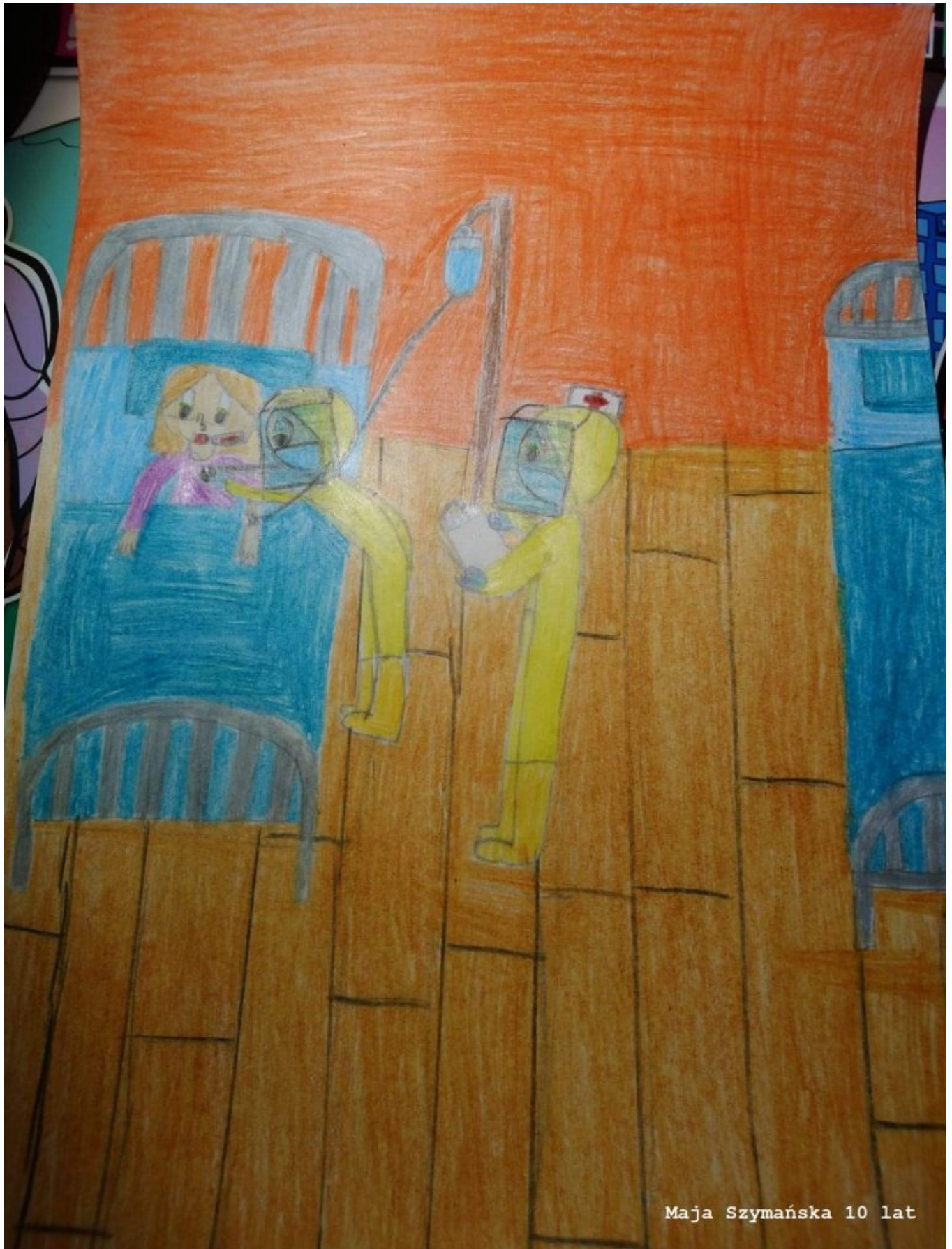
Maja Szymańska 10 lat