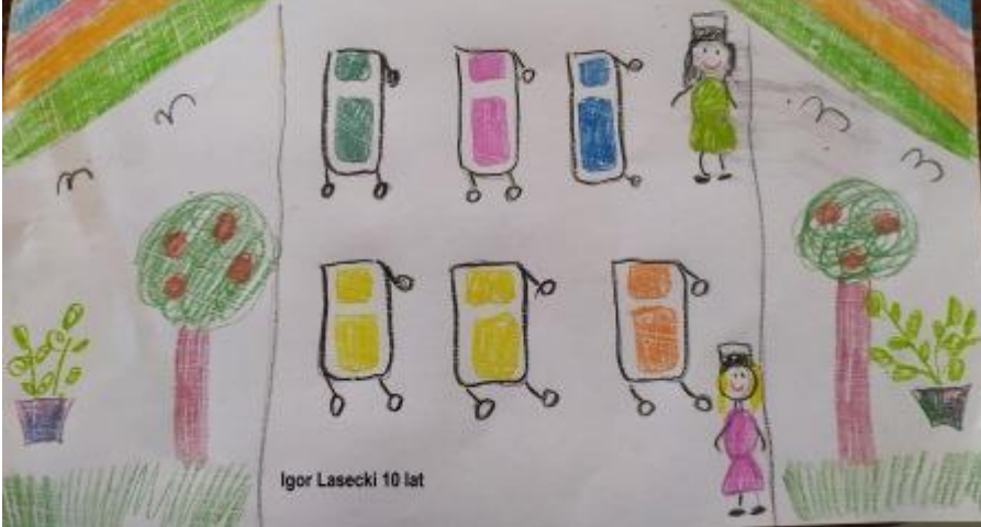
Igor Lasecki 10 lat